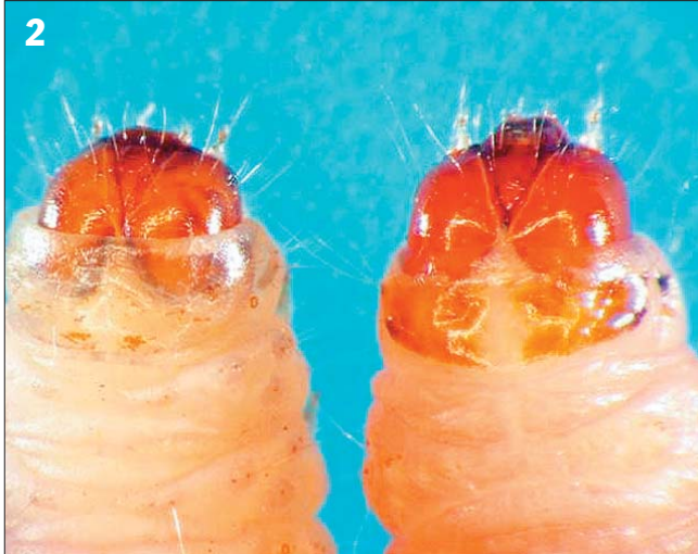
Foto 2: Larva de polilla de las nueces (izquierda) y larva polilla de la manzana (derecha).