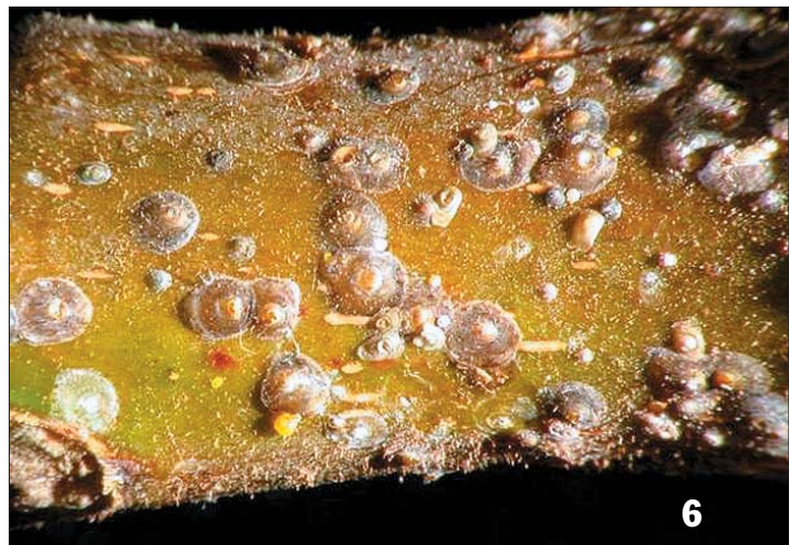
Foto 6. Escama de San José sobre ramilla de nogal.

La hembra adulta de la escama de San José ( Quadraspidiotus perniciosus ) está cubierta de un escudo de 1,5 mm de diámetro y de color gris oscuro; bajo él se