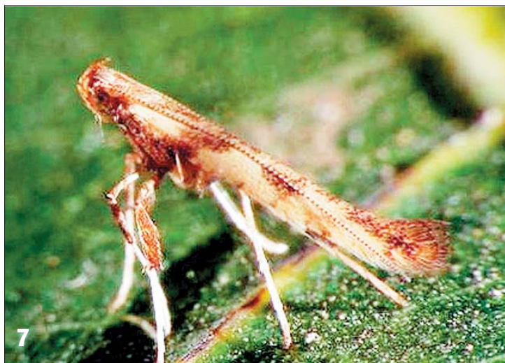
Foto 7. Adulto de minador del nogal, Caloptilia sp.