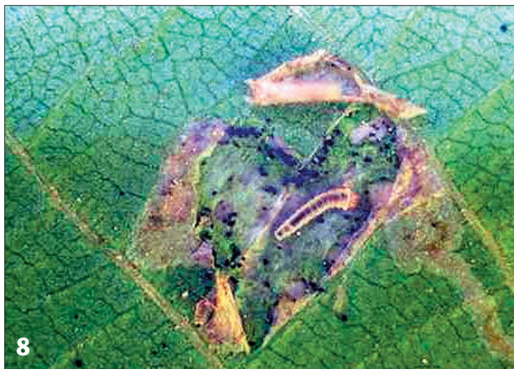
Foto 8. Larva de de minador del nogal.

protege el cuerpo amarillo (fotos 5 y 6).