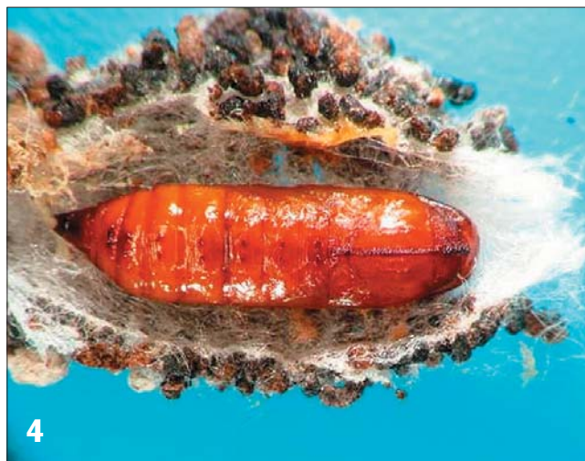
Foto 4. Pupa de polilla de las nueces.

La hembra y macho de arañita roja europea ( Panonychus ulmi ) son de color rojo ladrillo, con pelos blanquecinos que nacen de tubérculos claros, pero el macho es más pequeño. Los huevos son rojos, esféricos y ligeramente aplastados. Pasan el invierno en estado de huevo, que la hembra coloca en ramillas, yemas, bifurcaciones, etc.