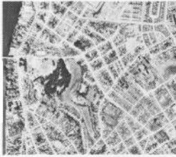
Fig. 3—Sector de la Ciudad de Valdivia a Escala 1:50.000