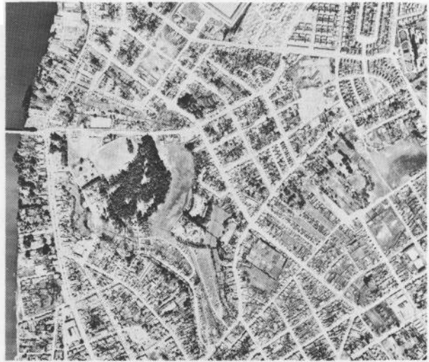
Fig. 4—El Mismo Sector a Escala 1:20.000