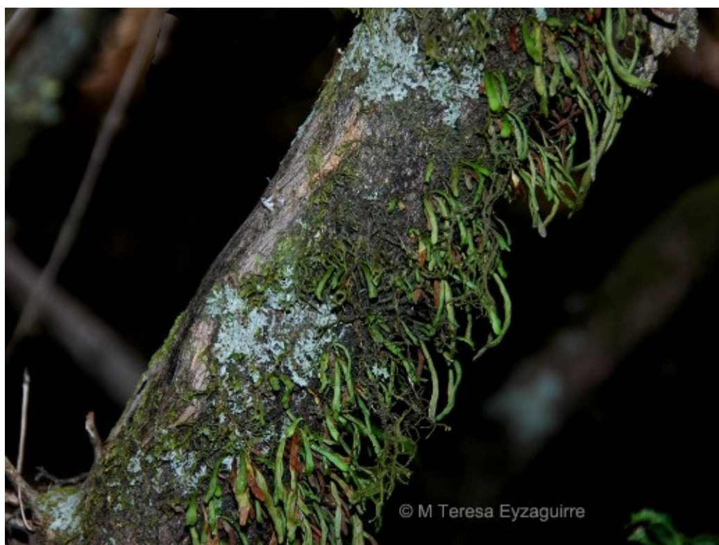
Figura 7.- Grammitis magellanica, helecho nativo distribuido desde Ñuble a Magallanes