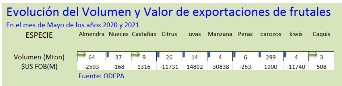
Figura 5.- Comparación de volumen y valor de exportaciones frutícolas del mes indicado entre 2020 y 2021