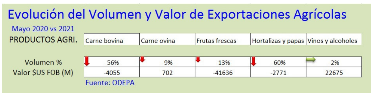
Figura 4.- Comparación de volumen y valor de exportaciones agropecuarias del mes indicado entre 2020 y 2021