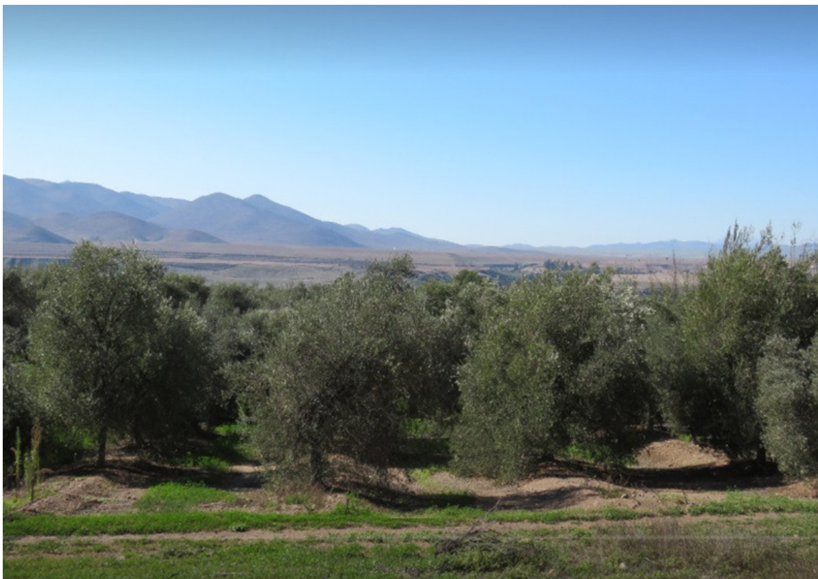
Figura 6.- Olivos del valle de huasco para producción de aceite con denominación de origen