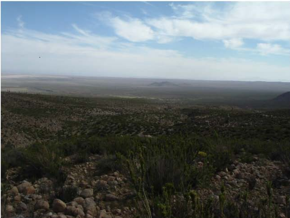
Foto 2. Vista general de la vega de Turi desde el cerro Paniri