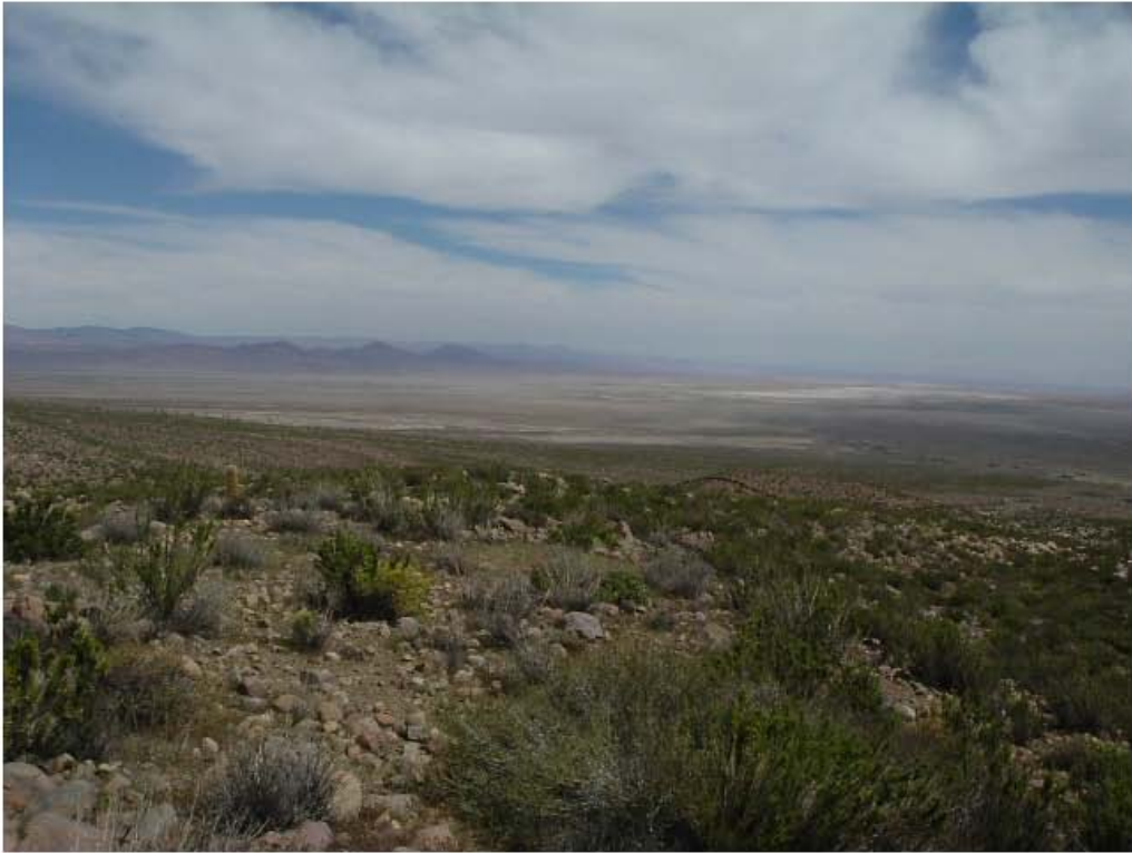
Foto 1. Vista general de la vega de Turi desde Cupo.