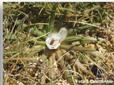
Foto 3 Calandrinia