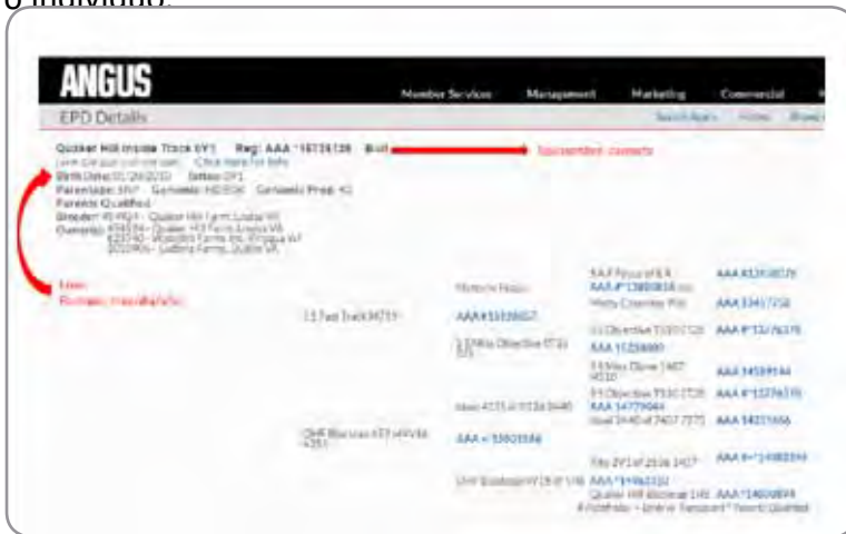
Foto 2. Obtenido desde el Sitio Web de la American Angus Association, en dicha página se indican las fechas de nacimiento en formato mm/dd/aa. Se debe tener mucho cuidado y corregir dicha diferencia en la nomenclatura.