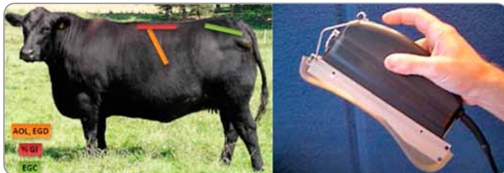
Foto 4. Posición para mediciones AOL, EGD, %GI y EGC. A la derecha transductor con acople de silicona.

Espesor de grasa dorsal (EGD): indica la grasa subcutánea de la 12 a costilla en la sección transversal de un \frac{3}{4} de la columna vertebral.