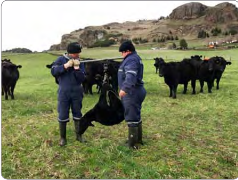
Foto 3. Ejemplo de registro peso al nacimiento en INIA Tamel Aike

Peso Nacimiento: se aceptará un rango de 48 horas máximos respecto del día de nacimiento (Foto 3).