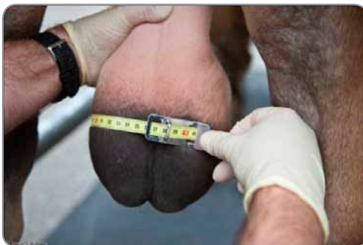
Foto 5. Medición de la circunferencia escrotal en un toro.

Circunferencia escrotal: se encuentra asociada a la producción espermática y, por tanto, al potencial reproductivo de un macho. Debe ser medida en centímetros, en sentido horizontal, abarcando ambos testículos y el escroto (Foto 5).