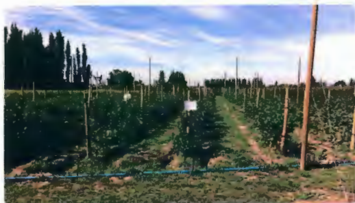
Kakerume tukukan tukuñmuafui che

Utrukongen ta mapu, anó mawünle kam müte mawün-nofule rume, küme wulafui ti tukukan, kafey.