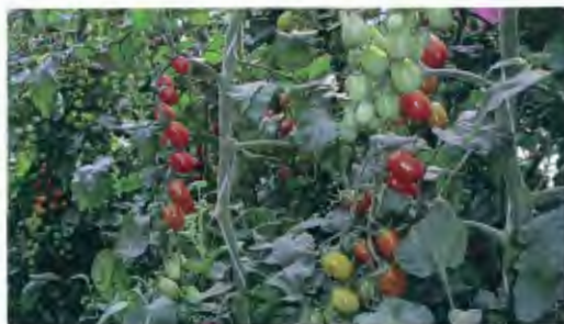
Doy küme wulkey tukukan