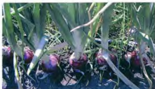
Doy kümeke fun wulkey ti tukukan